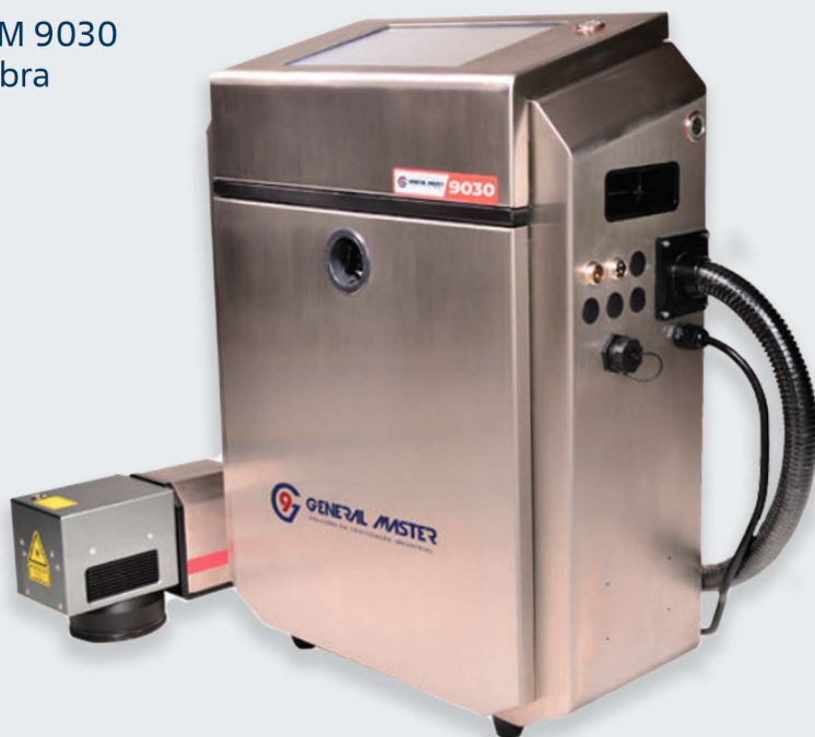
GM 9030 Fibra