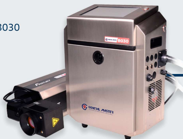
GM 8030 CO2